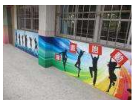
表演藝術意象設計 學生創作大圖樓梯