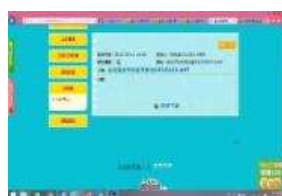
校園場地開放上網