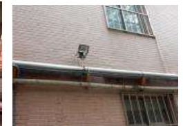
校園死角自動感應燈