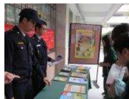
駐警合作防災宣導