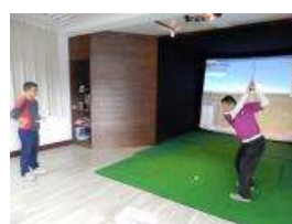
高爾夫訓練基地(前)