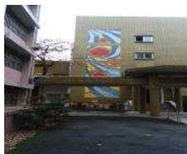
活動中心馬賽克圖