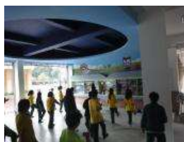
文化走廊社團活動