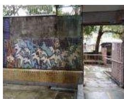
校園角落馬賽克圖