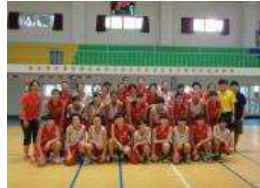
馬來西亞籃球交流