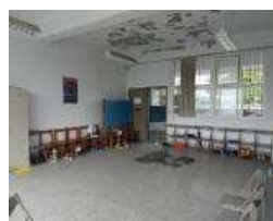
高爾夫訓練基地(前)