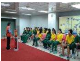
校外教學防災宣導