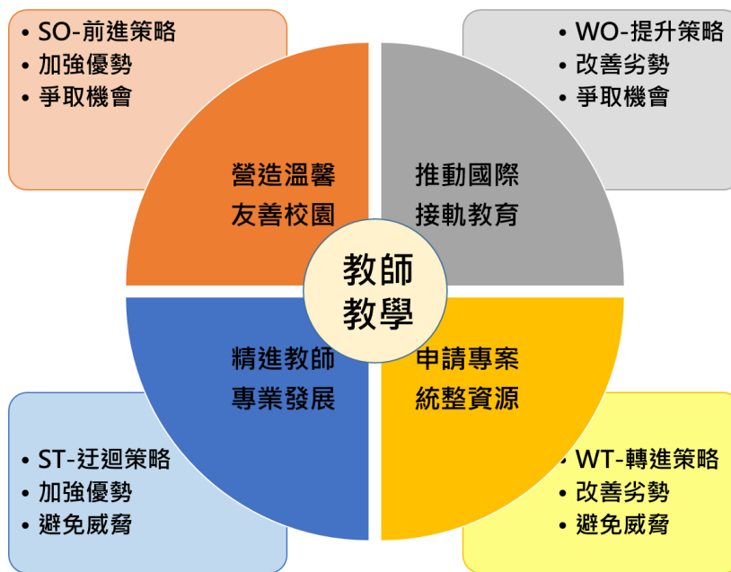
圖1. 民族國中「教師教學」策略架構圖