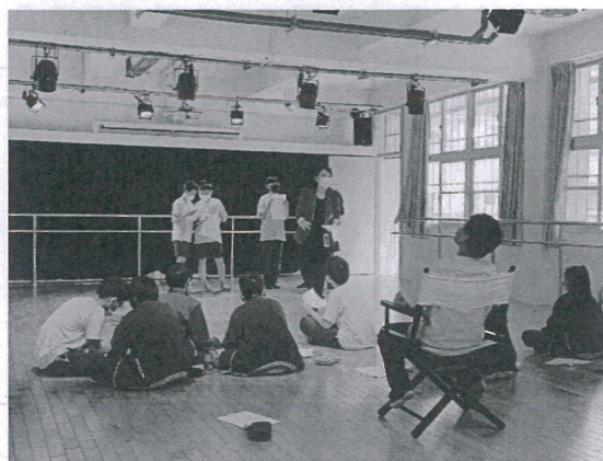
說明：教師示範表演動作，指導走位