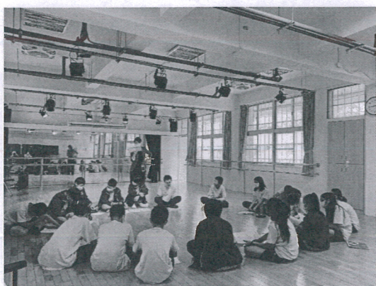
說明：教師帶領發聲，進行排練暖身