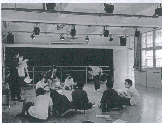
說明：學生開始排練