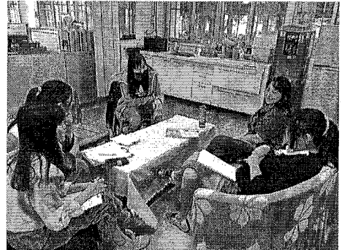
說明：觀課小組回饋分享