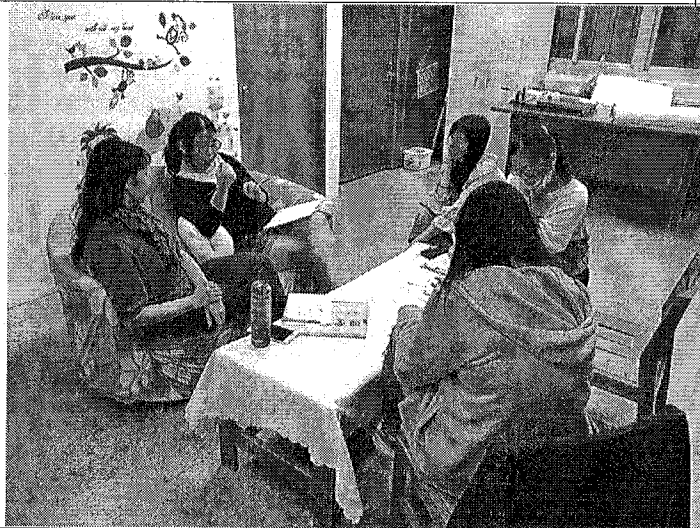
說明：針對教學設計進行討論