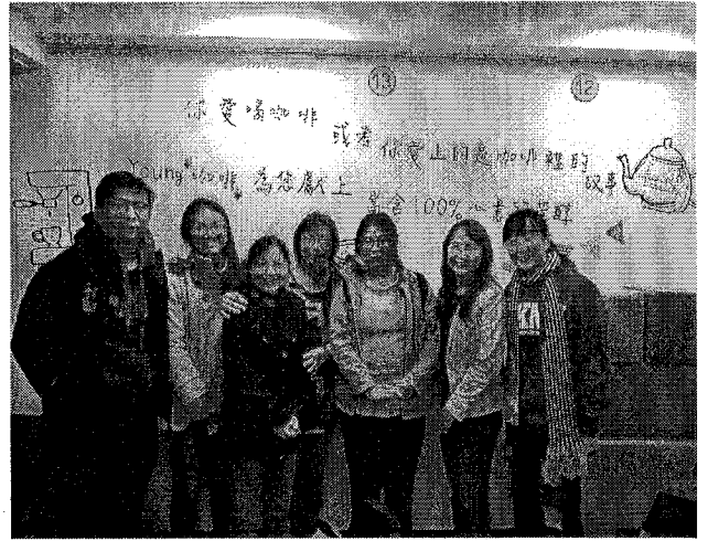
活化教學增能研-生命暨生涯議題 代間學習