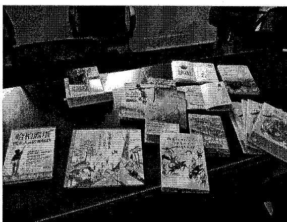
活化教學增能研習-帶著綜合課程去郊遊 Your Vision Our Future