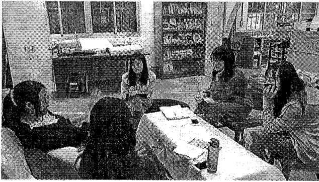
說明：報告人分享教學省思