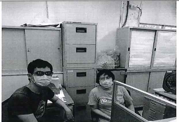
110.5.20 日社會領域工作坊照片。