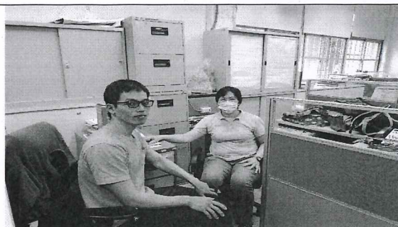
110.5.4 日社會領域工作坊照片。