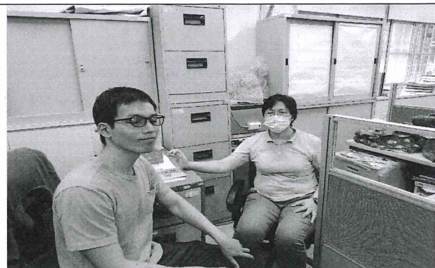
110.5.4 日社會領域工作坊照片。