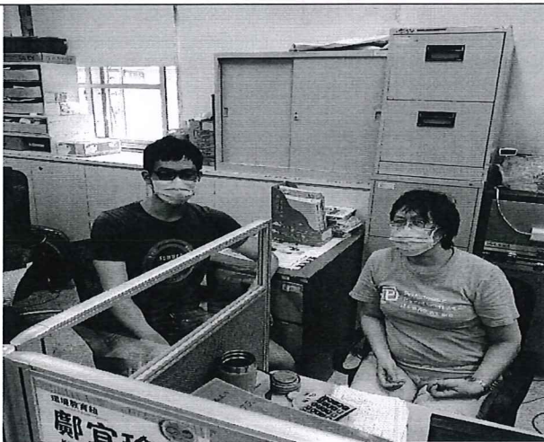
110.5.20 日社會領域工作坊照片。