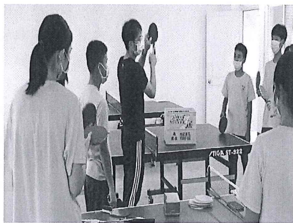
說明：持拍與球拍介紹