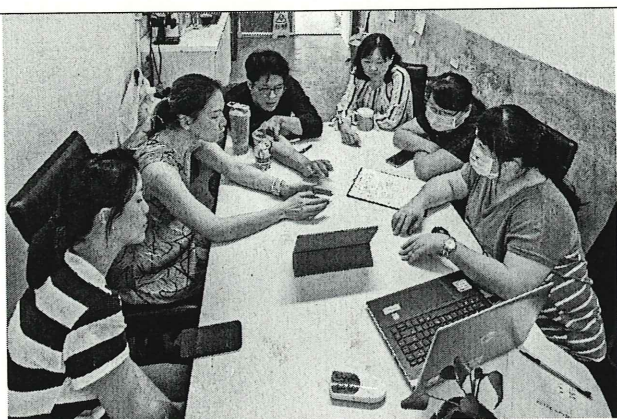
說明： 孟以 師回饋觀課感想。