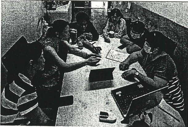
說明： 孟以 師回饋觀課感想。