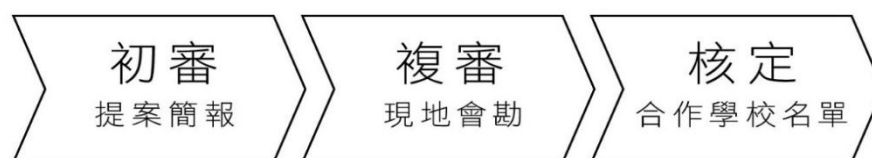
圖 3 徵選流程