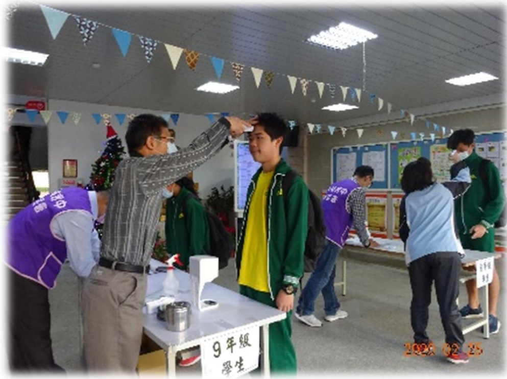
防疫工作校門口量測體溫及消毒情況