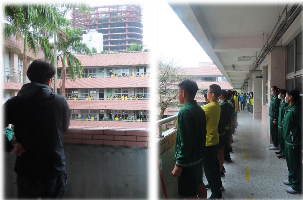
為落實防範新冠肺炎師長在走廊開放空間進行宣導