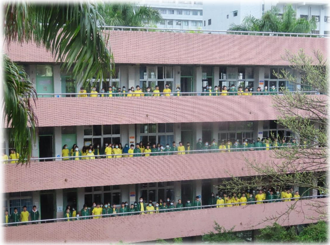
學生於走廊聆聽宣導情況