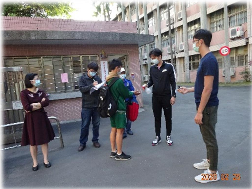
校長關心開學學校防疫人員 於校門口執行工作情況