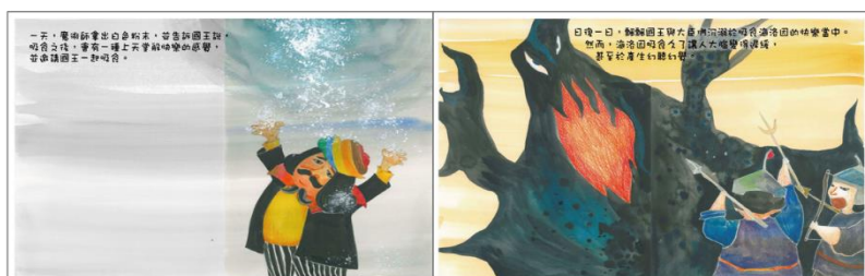
※範例作品：教育部反毒繪本—飄飄王國滅亡記/洪孟真、呂舒婷