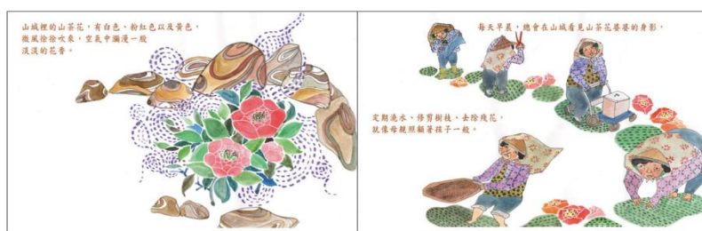
※範例作品：教育部反毒繪本—山茶花婆婆/洪孟真、呂舒婷