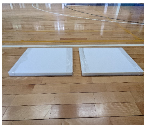
照片3：防疫隔板30片(一疊15片)